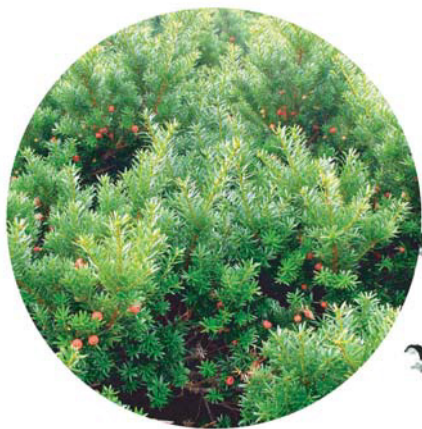
特別天然記念物 大山キャラボク

大山登山 所要時間【往復】：約6時間 登り：登山口→【50分】→3合目→【55分】→6合目→【60分】→山頂 下り：山頂→【55分】→6合目→【10分】→元谷別れ→【40分】→元谷→【30分】→大神山神社→【15分】→大山寺