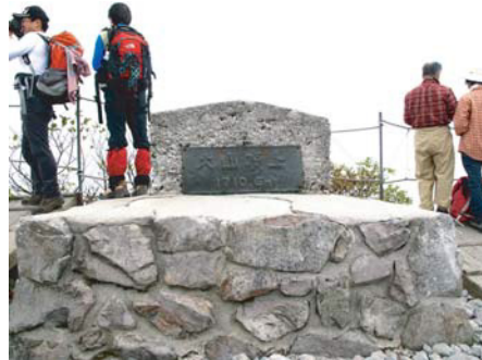
⑪ 大山山頂 1709m