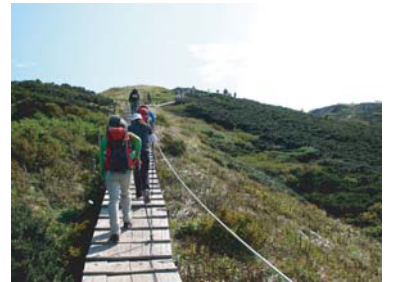
⑨ 九合目 木道