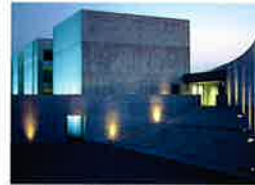
植田正治写真美術館